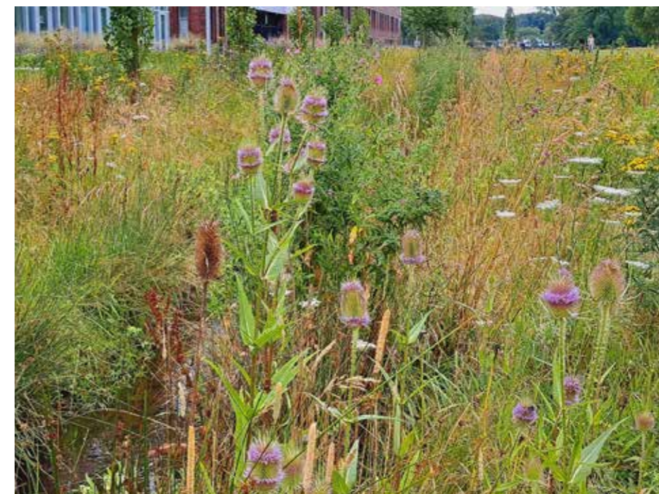
Het effect van meer natuurinclusief beheer geeft snel meer bloei en meer variatie

voedsel en schuilgelegenheid (veiligheid en voortplanting). Maar ook mogelijkheden voor verplaatsing zijn goed. Niet alleen in een horizontale richting maar ook in verticale richting door de wisselwerking tussen bodem, kruidentlaag, struiken en boomtoppen.