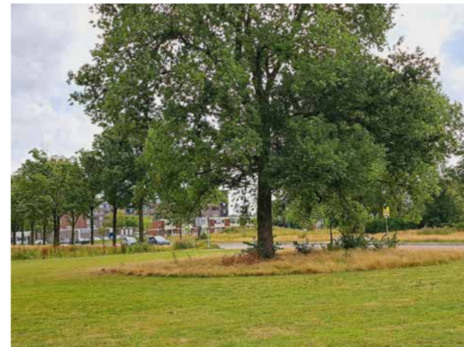
Onder de kruin van de boom wordt niet het hele jaar gemaaid

Bomen zijn in belangrijke mate de dragers van onze groenstructuren. Ze zijn groot, kunnen oud worden en ogen sterk. Willen we de bomen vitaal houden, dan is gericht onderhoud cruciaal. De eerste trede is om niet meer (altijd) tot aan de stam van de boom te maaien. We blijven er een meter vanaf. Juist deze zone tussen gras/kruidentlaag en stam van de boom is essentieel voor uitwisseling van leven. Dit gaan we overal doen. Bij trede 2 wordt onder de hele kroon van de boom niet meer gemaaid. De grond onder de boom wordt zo niet verdicht, waardoor vocht en lucht gemakkelijker in de bodem terechtkomen. Ook wordt het blad onder de boom niet meer verwijderd en kan ook het waterlot (nieuwe twijgen) langer blijven uitgroeien. Dit stimuleert het bodemleven onder de boom en zorgt voor een betere voedselvoorziening voor de boom. Op de derde trede van de ladder zal ook in de winter niet gemaaid worden onder de bomen en krijgen struiken de kans om uit te groeien. Grootschalig ingrijpen zal één keer in de 5 jaar nodig zijn. Hiermee ontstaat een bijna optimale ecologische situatie waarbij veel variatie is in