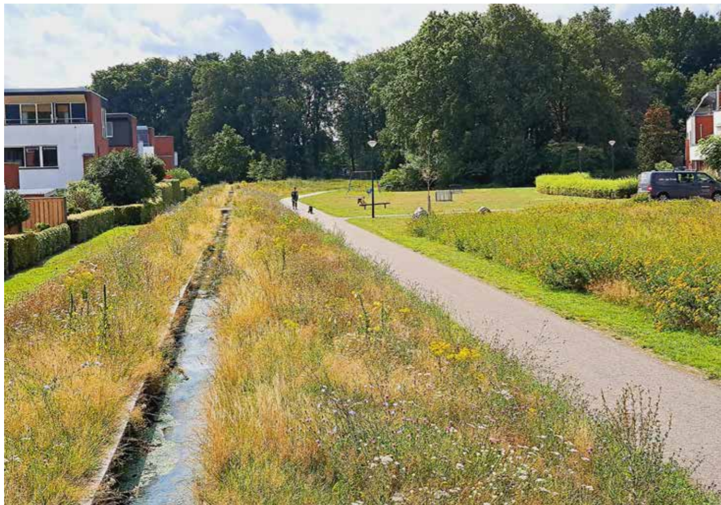
Waar veelvuldig wordt gespeeld wordt vaak gemaaid