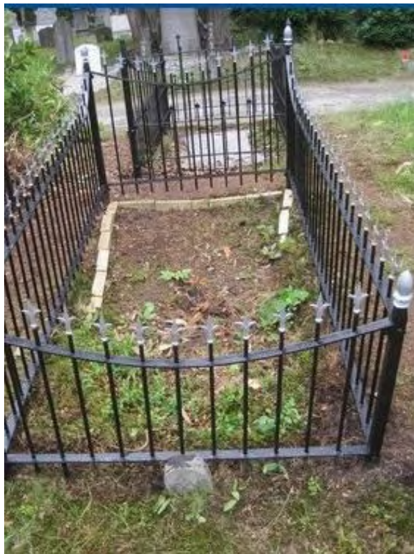
Graf Westerbroek / 03- 343 voor en na schilderen van het hekwerk.