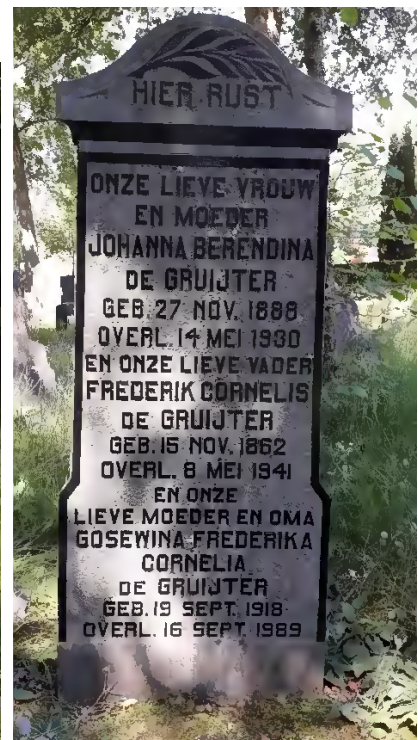
Graf De Gruijter / 04- 0505A.