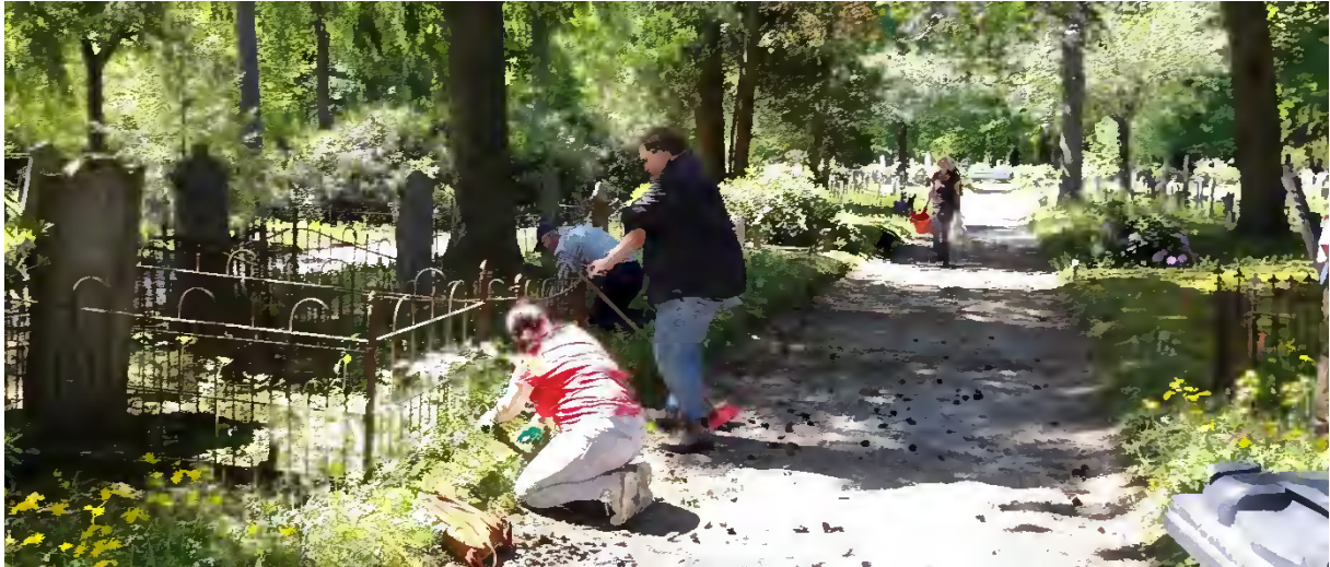
Lekker buiten in het zonnetje schoonmaken.