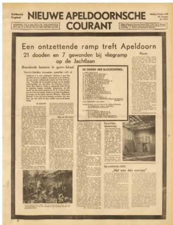
Voorpagina van de Nieuwe Apeldoornsche Courant van 8 oktober 1946.

De helft van de Nieuwe Apeldoornsche Courant van 8 oktober 1946 is gewijd aan het ongeluk, bijna twee van de slechts vier pagina's waaruit de krant bestond. Er heerste zo kort na de oorlog nog enorme papierschaarste.