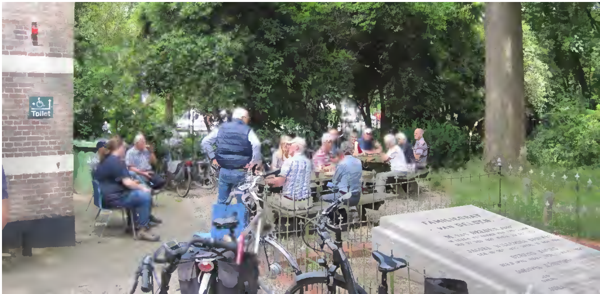
Om half drie houden wij altijd een gezellige pauze met koffie, thee en meestal iets lekkers