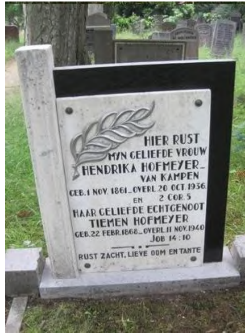
Graf Hofmeyer / 04- 1168A. Voor en na het schoonmaken en schilderen van de tekst.