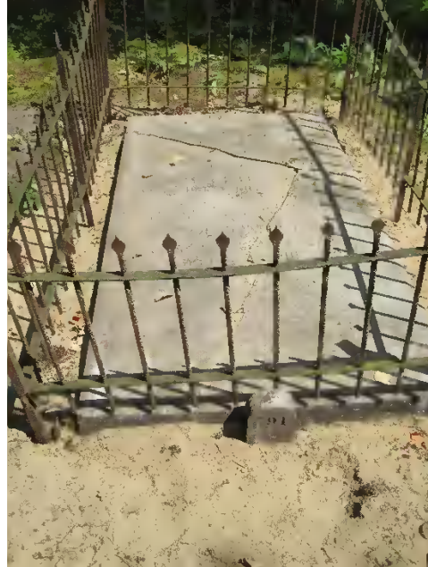
Graf Huigen / 03 – 791 voor en na. Het hekwerk wordt in 2022 geschilderd.