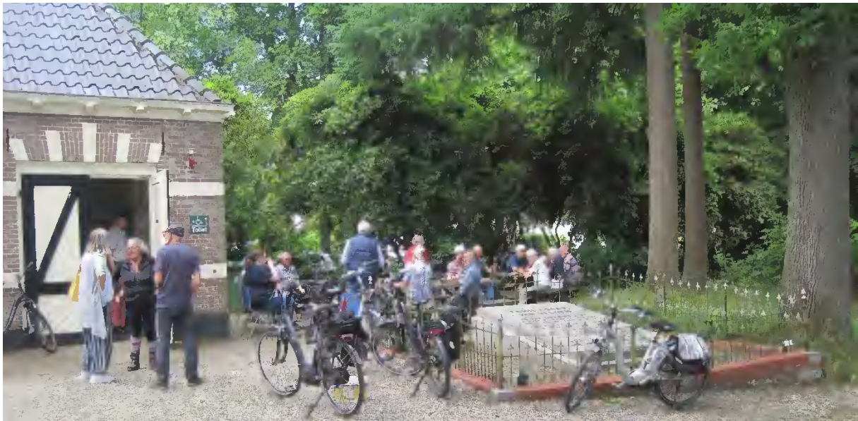
Tijd voor koffie, thee, iets lekkers en bijpraten.