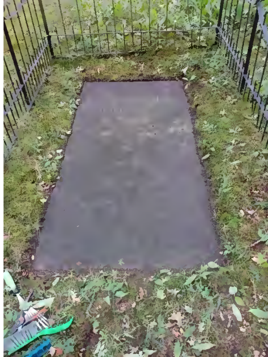
Graf Van den Ende / 01- 0140 voor en na de schoonmaak.