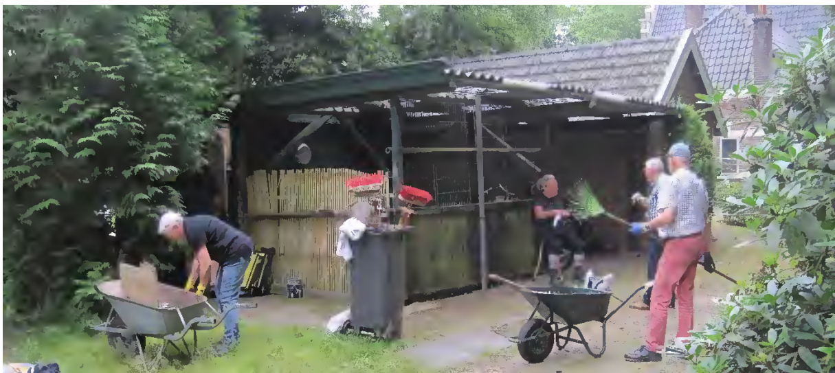
Na gedane arbeid, spullen schoonmaken en opruimen.