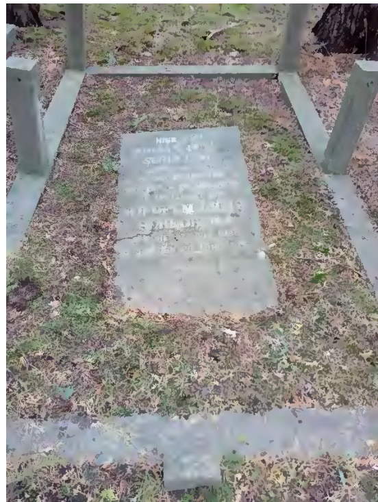
Grav Scheltema / 01 – 0437.