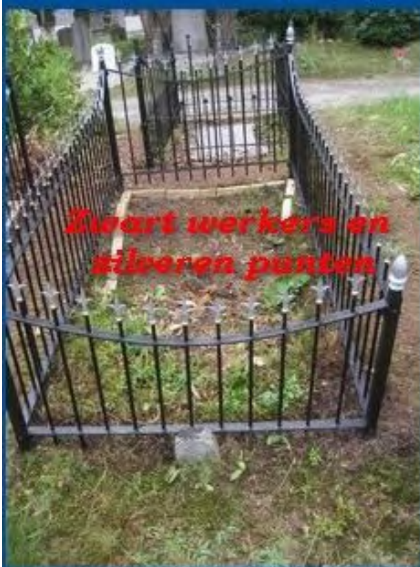
Swart werkers en zilveren punten