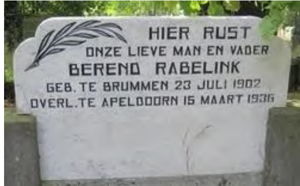
Graf Rabelink / 04- 1095 A. Voor en na het schoonmaken en schilderen van de tekst.