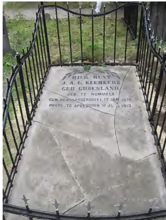
Werkzaamheden: Takelen, puzzelen, lijmen, tekst en hekwerk schilderen.